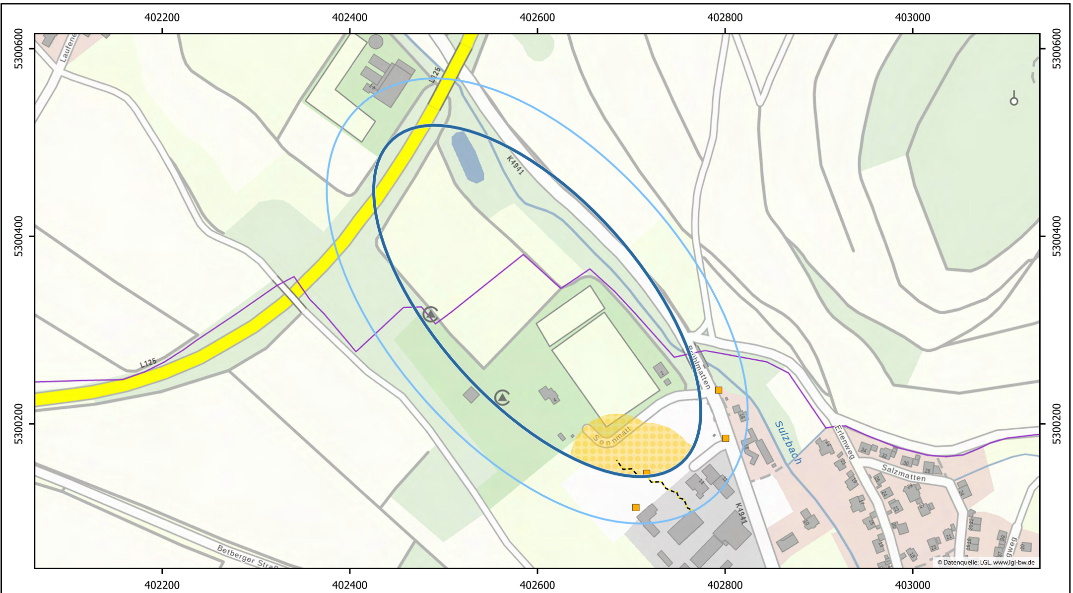
Ergebnis der Vorerkundung auf Kampfmittelbelastung. Lediglich Befunde innerhalb der Auswertungsfläche sind dargestellt.