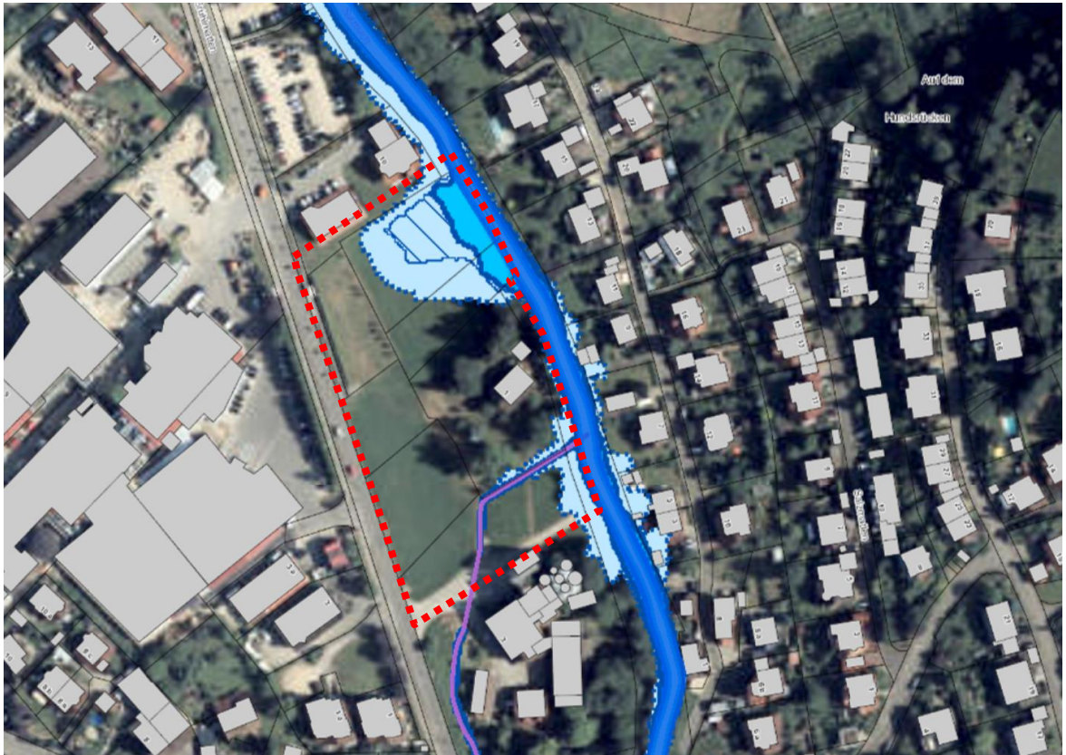
Ausschnitt aktuelle Hochwassergefahrenkarte mit dem Plangebiet LfU (ohne Maßstab)