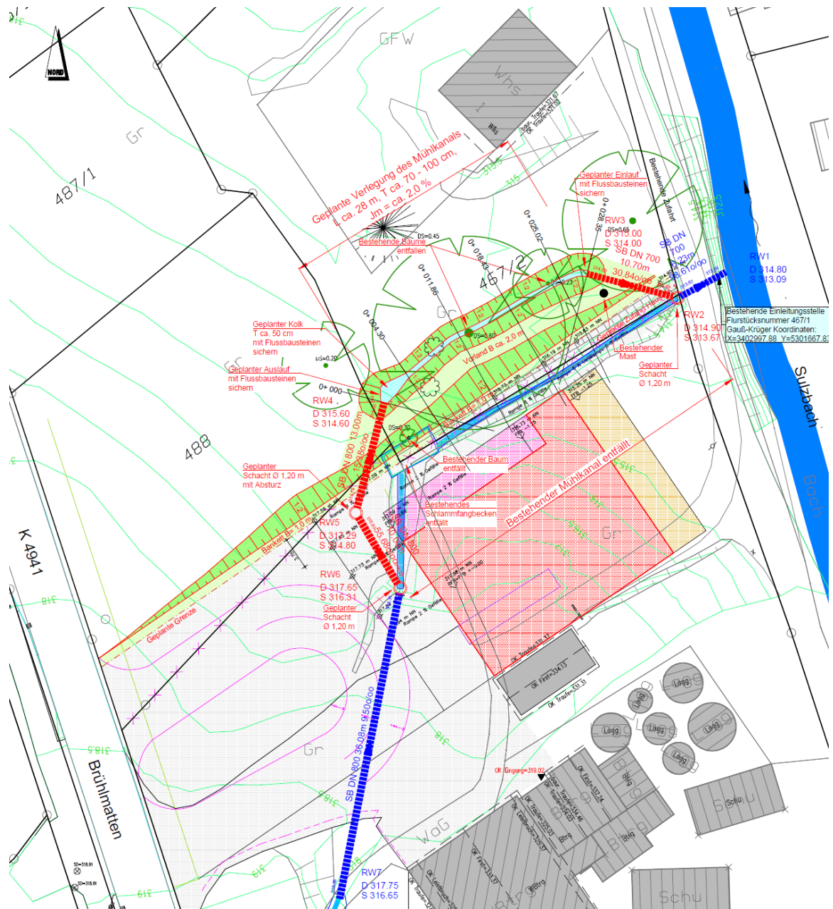
Aktuelle Planung Verlegung Mühlekanal